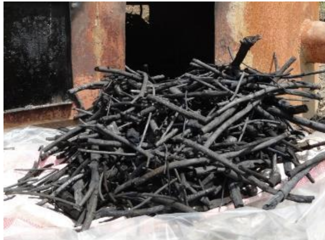
Abbildung 6: Holzkohle und ihre technischen Daten