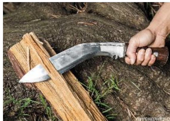
Abbildung 4: Für die Ernte verwendete Werkzeuge