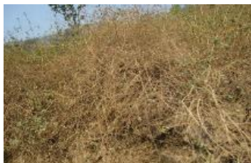
Lantana aculeate L.