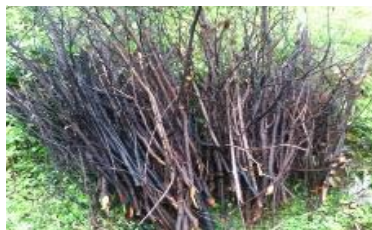
Zweige und Äste