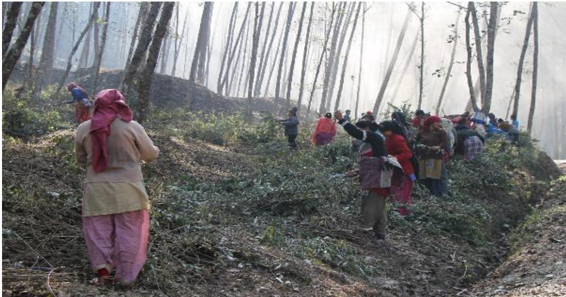
Abbildung 3: Waldnutzer bei der Rückstandsernte