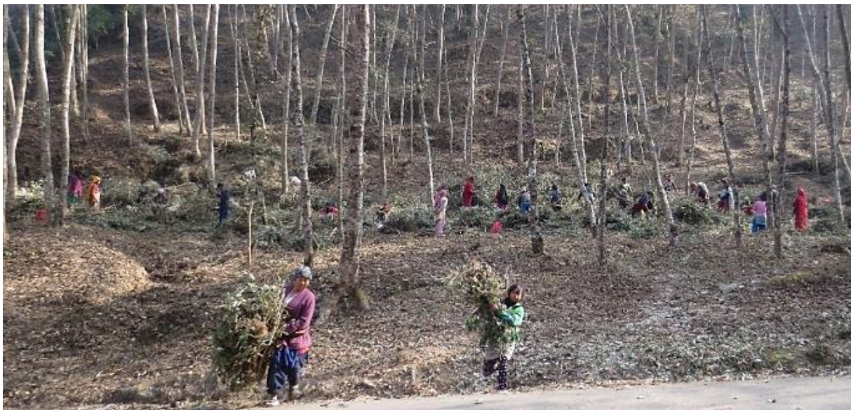
Abbildung 5: Transport der Biomasse aus dem Community Forest