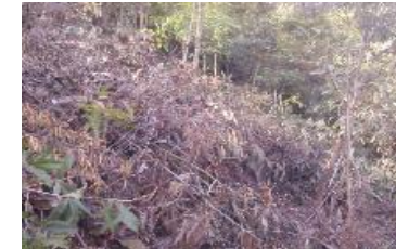
Zweige und Blätter